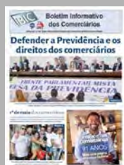
Confira o Informativo dos Comerciantes

A publicação " A OIT no Brasil " descreve as principais conquistas da OIT e detalha as atividades atuais da OIT para promover o trabalho decente no país. Ela oferece uma breve história da relação da OIT com o Brasil, uma visão geral da situação atual do país e os principais desafios remanescentes em questões relacionadas ao mundo do trabalho