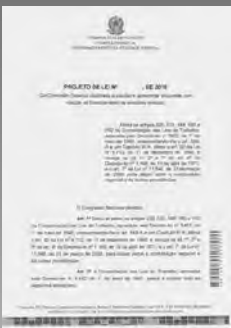
Projeto de Lei Consolidado