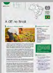
A OIT no Brasil

O UGT Global é o Boletim de Informação Internacional da União Geral dos Trabalhadores.