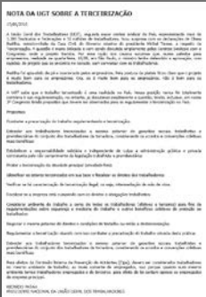
Nota da UGT sobre a Terceirização

O Projeto de Lei Consolidado, referente o Financiamento da Atividade Sindical, foi votado em 06.07.2016, na Comissão Especial destinada a Estudar e Apresentar Propostas com relação ao Financiamento da Atividade Sindical. O relatório será numerado na forma de Projeto de Lei e seguirá para mesa diretora determinar o despacho para prosseguir a tramitação.