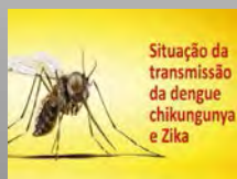
Situação no Brasil 02/2016

Cada um pode fazer a sua parte. Participe! Conheça o Movimento Nacional para os ODS.